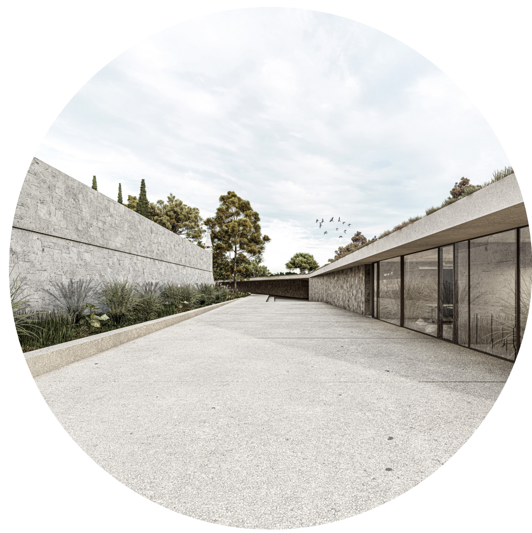
Ulazni prostor s javnim sadržajima