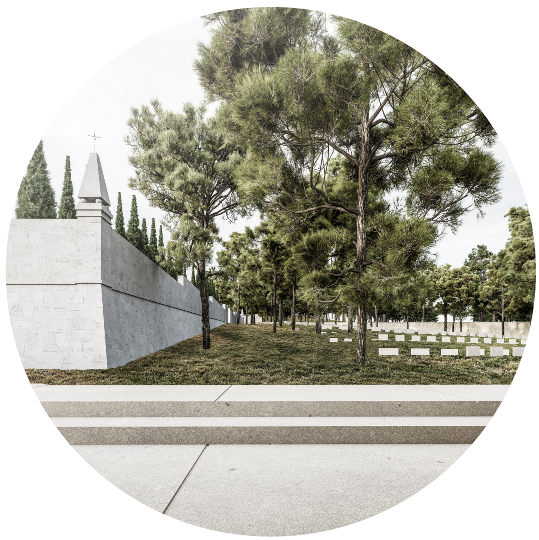
Oproštajni prostor u osi između 2. i 3. faze groblja