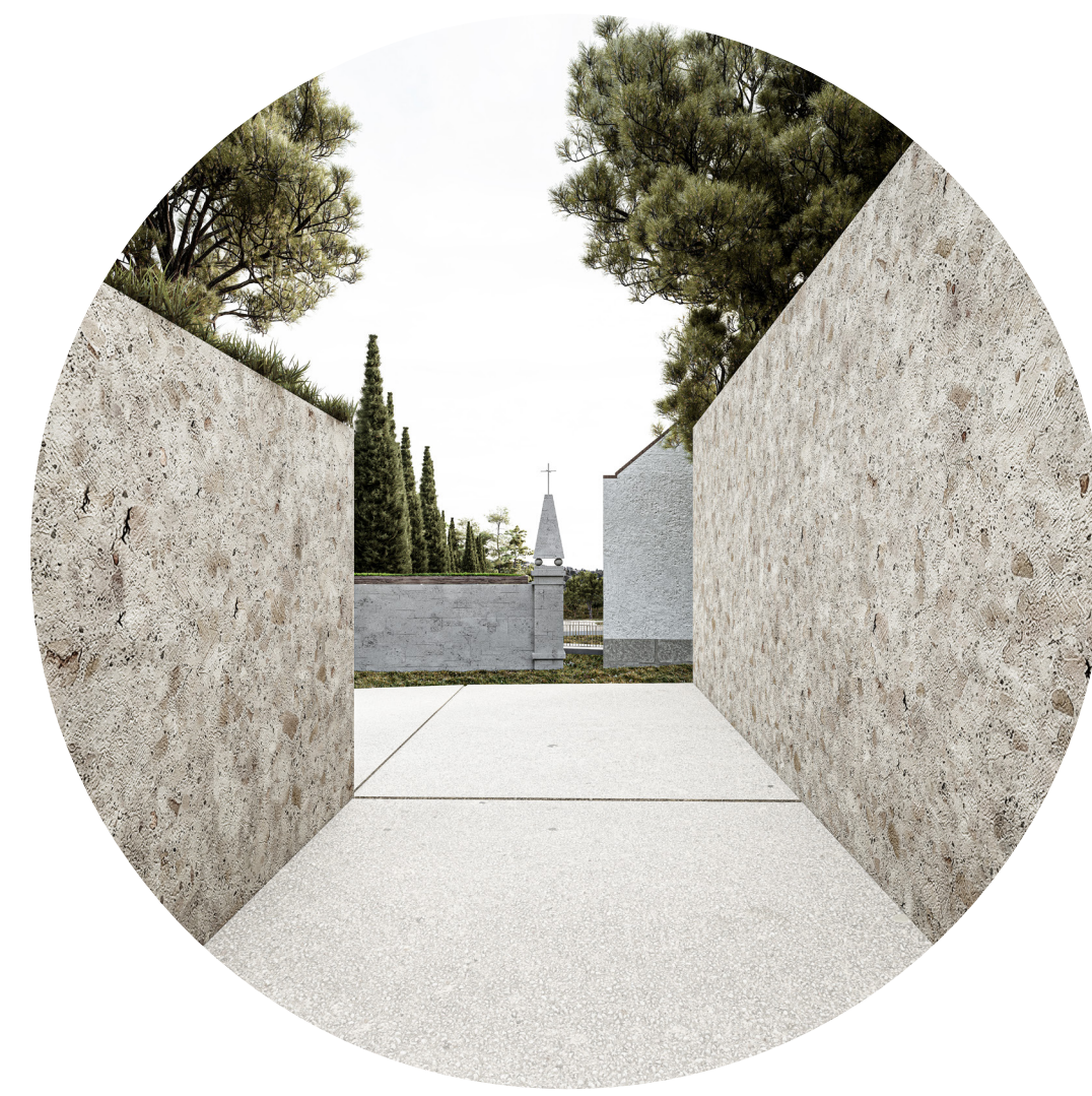
Put prema prostoru za prosipanje pepela