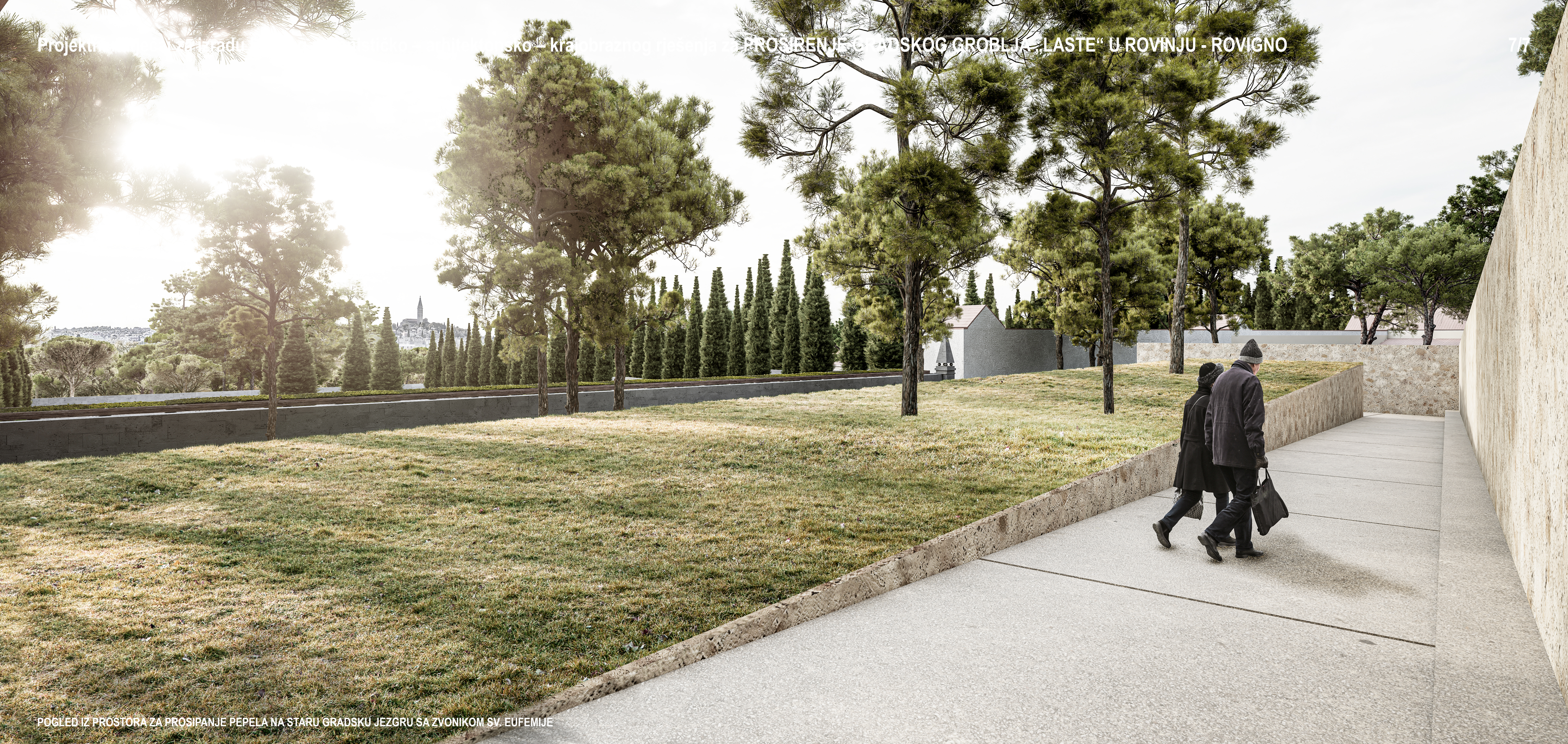
POGLED IZ PROSTORA ZA PROSIPANJE PEPELA NA STARU GRADSKU JEZGRU SA ZVONIKOM SV. EUFEMIJE