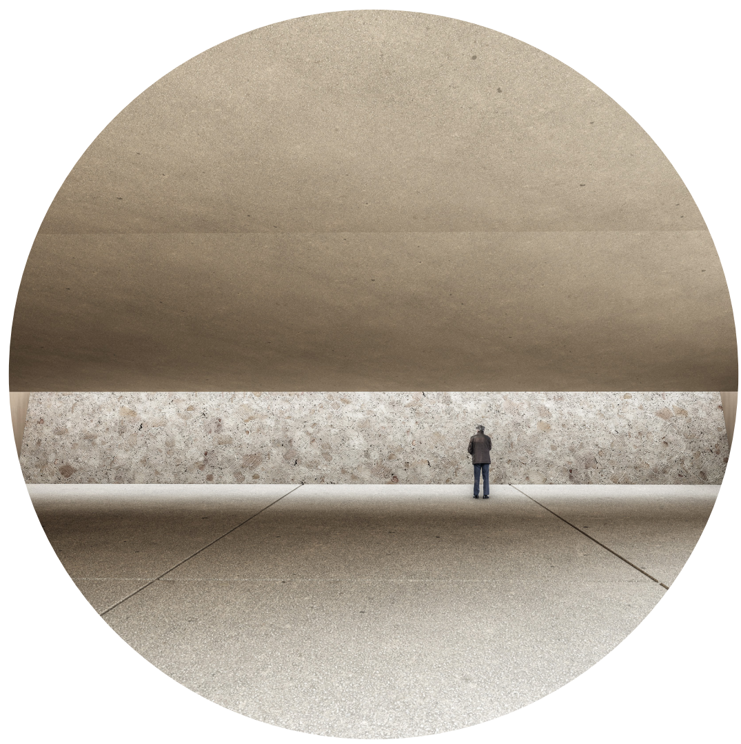
Zenitalno osvetljenje oproštajnog prostora