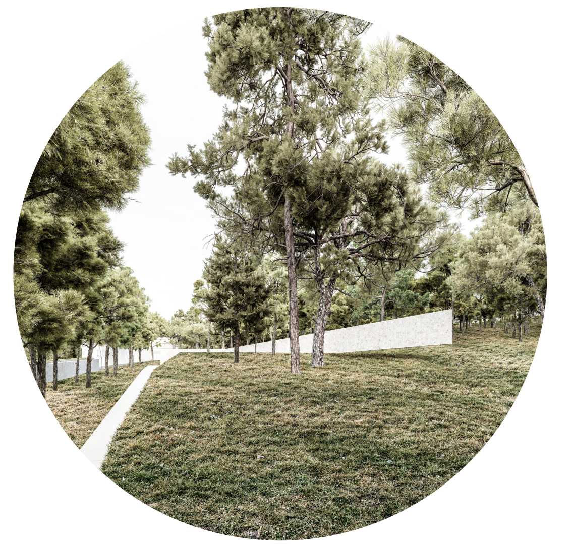
Lebdeći zid na platou za posipanje pepela