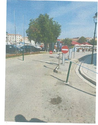
DOPUNSKA PLOČA E 07 "Osim za bicikle Eccetto per biciclette"

DODATNI PROMETNI ZNAK NA ULAZU U PJEŠAČKU ZONU TRG BRODOGRADILIŠTA